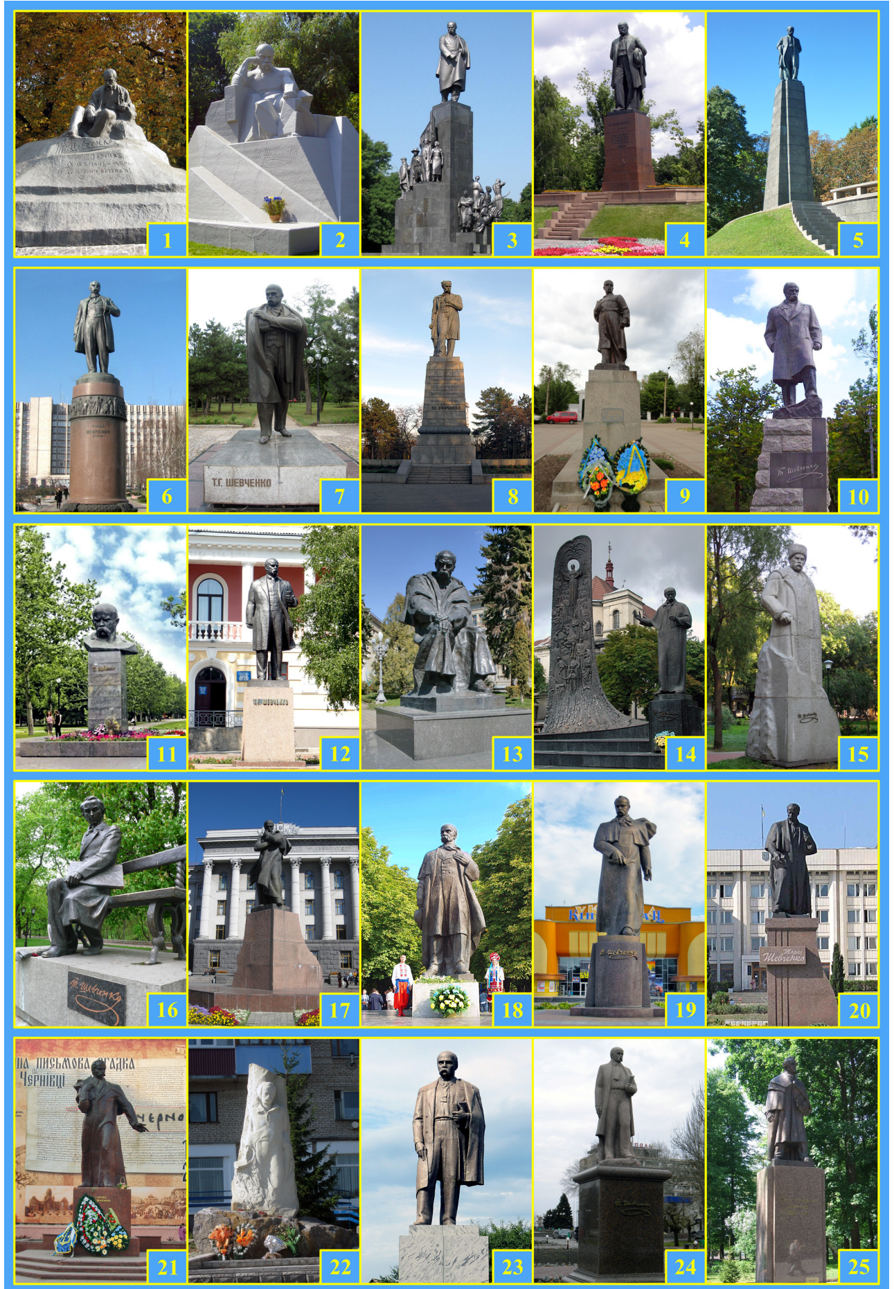
Рисунок 2. Скульптурні пам'ятники Тарасу Шевченку в Україні