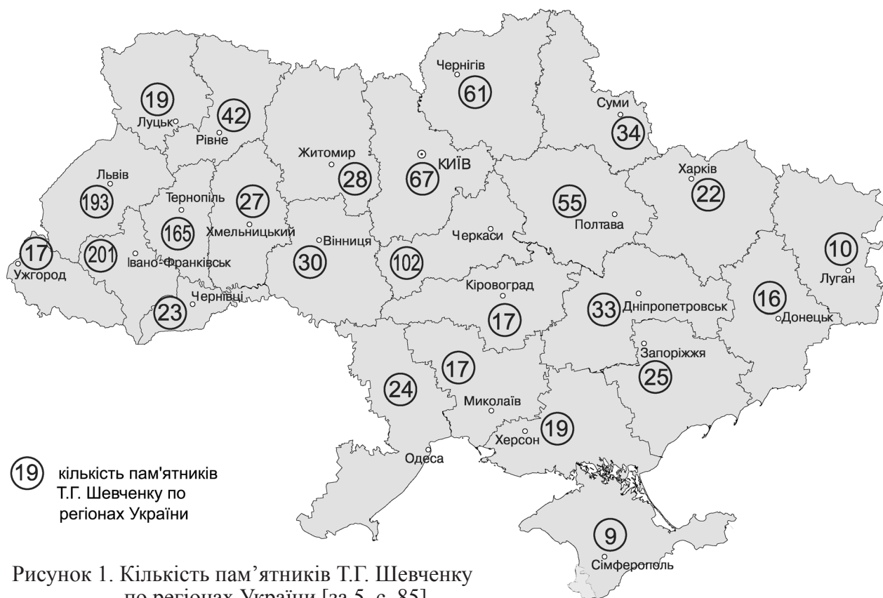
Рисунок 1. Кількість пам'ятників Т.Г. Шевченку по регіонах України [за 5, с. 85]

Підписи до рисунка 2 (фото розміщені за хронологією встановлення пам'ятників; у дужках - рік встановлення, автори)