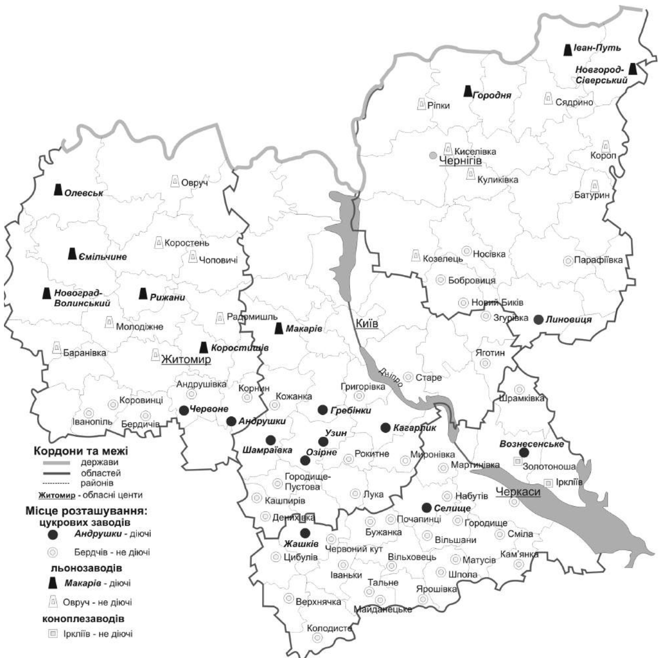
Рисунок 3. Київське Придніпров'я. Цукрові заводи та підприємства з переробки луб'яних культур, 2015 р.

ця культура взагалі не вирощується сільськогосподарськими виробниками регіону (рис. 3).