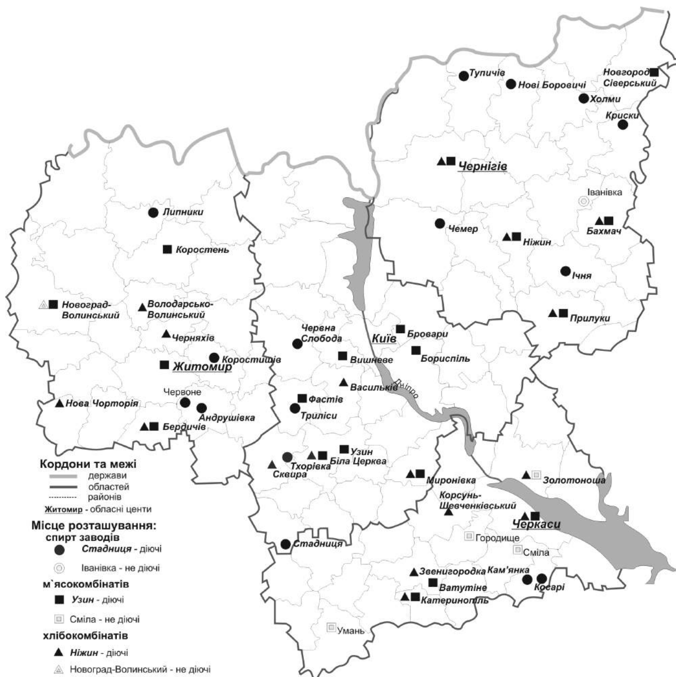
Рисунок 4. Київське Придніпров'я. Спиртові заводи, м'ясокомбінати та хлібокомбінати, 2015 р.

країни: 13 % свинини, 27 % яловичини, 51 % м'яса птиці. Упродовж 1990 – 2015 рр. галузь зазнала істотних змін: відбулося загальне зменшення виробництва (на 10 %) та зміна у його внутрішній структурі: із 23 м'ясокомбінатів, які функціонували в 1990 р., нині працюють 19 (рис.4), зменшилося виробництво яловичини та свинини, зросло виробництво м'яса птиці. Останнім часом регіон є найбільшим виробником м'яса птиці. Тут збудовано великі птахокомбінати, які виробляють половину від загальнодержавного показника продукції. Зокрема, «Миронівський хлібопродукт» та «Агротарс» виробляють близько 60 % м'яса птиці регіону. Підприємства м'ясопереробної промисловості