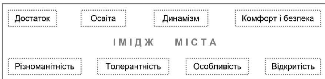
Рис. 1. Складові аспекти іміджу міста, що сприяють розвитку креативної діяльності

4. При розробленні методики дослідження стану розвитку креативної діяльності в Україні було