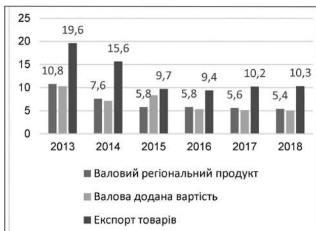
Рис. 1. Частка Донецької області за макроекономічними показниками, %

Зміни відбулися і в промисловості регіонів Донбасу. Найбільше падіння виробництва про-