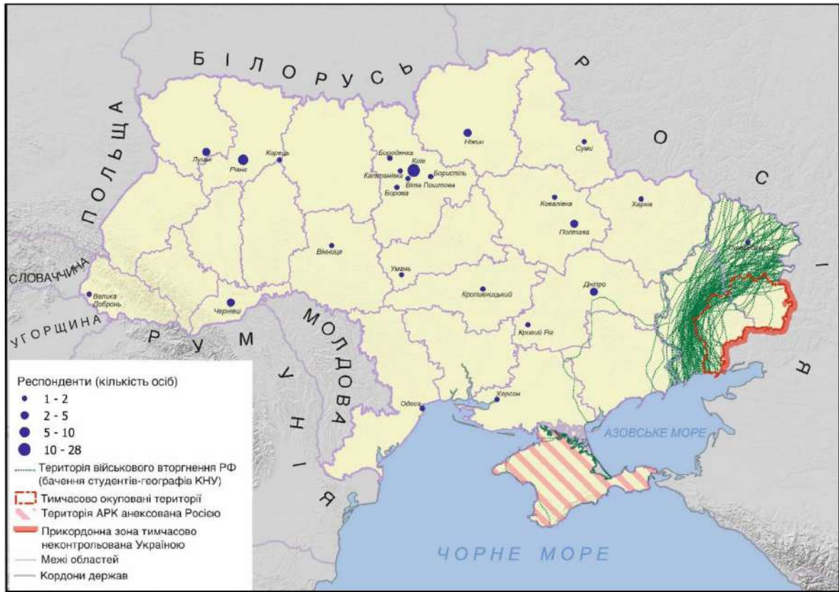
Рис. 1. Локації місць анкетного опитування та сприйняття тимчасово окупованих територій України студентами - географами