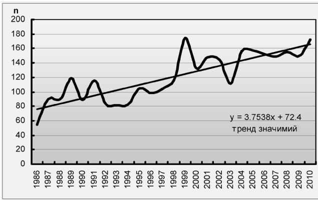
Рисунок 2. Щорічні коливання стихійних метеорологічних явищ на території України. Кількість випадків (n), — — — — лінійний тренд

Для детальнішого вивчення характеру зміни стихійних метеорологічних явищ було побудовано і проаналізовано тренди кількості випадків усіх явищ, зафіксованих на території України (рис. 2).