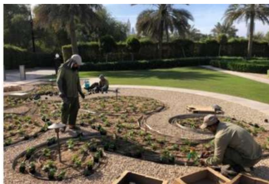
Рис.5. Дубаї: транспортні розв'язки і створення зелених зон