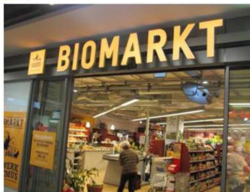
Рис. 3. Берлін: брендінг міста