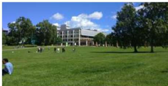
Рис. 2. Стокгольм: міський та університетський парки