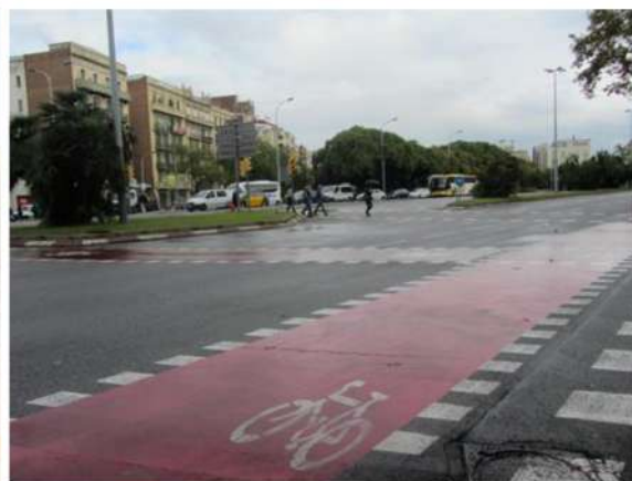
Рис. 4. Барселона: площа Каталонії і дорожня розв'язка