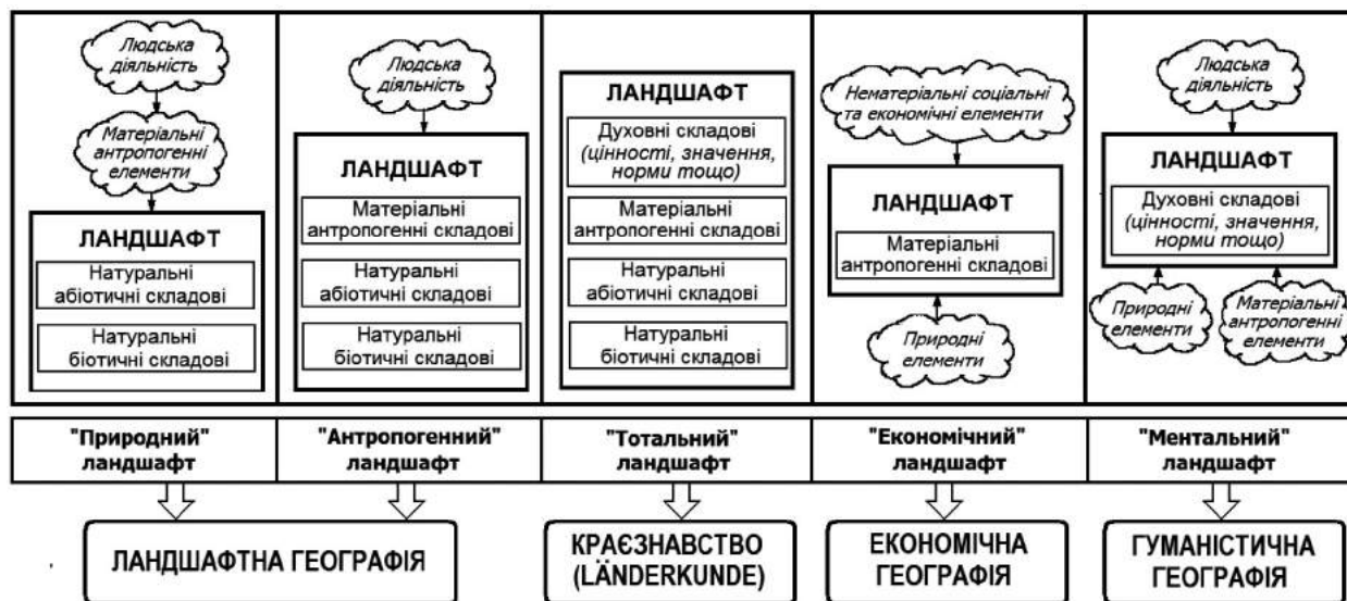
Рисунок 2. П'ять загальних інтерпретацій поняття ландшафту та науки, які на них спираються (за [3] зі змінами)

Теоретично розбудова ландшафтної географії можлива на основі будь-якої з наведених на рис.2