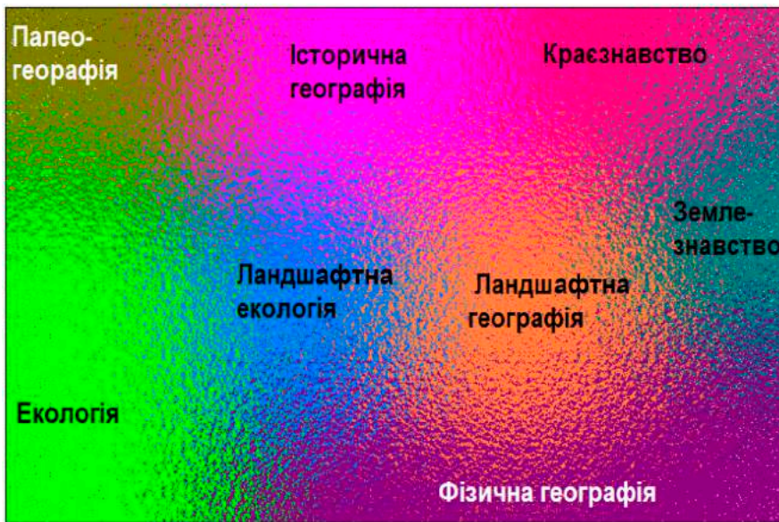
Рисунок 3. «Поле» наук про ландшафт і положення географічного ландшафтознавства у ньому

інтерпретацій ландшафту. Власне, це й відбувається, але відповідні ним напрямки географії мають свої традиційні назви. Нині більшість публікацій з ландшафтної географії ґрунтуються на тлумаченні ландшафту як природного феномену. Крім такого, суто природничого («пасаргівського»), розуміння цієї науки, поширеними є й ландшафтно-географічні описи регіонів, в яких ландшафт розуміють як природне середовище людини, змінене її діяльністю («антропогенний» ландшафт. Географічні дослідження, які ґрунтуються на «тотальному» розумінні ландшафту й, крім матеріальних, охоплюють також його духовні складові, отримали назву краєзнавчих (у Геттнера - Länderkunde ). «Регіональна наука» ( Regional science – в англійській мові) і Économique spatiales – у франкомовному науковому середовищі), оперують поняттям «економічного ландшафту», а серцевиною гуманістичної географії ( Humanistic geography ) є інтерпретація ландшафту як відображення устрою простору у свідомості людини («ментальний» ландшафт на рис. 2).