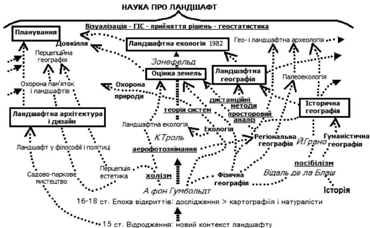
Рисунок 1. Схема розвитку науки про ландшафт та взаємодії між її дисциплінами (за [1])

редне відношення має саме ця комплексна частина регіональної фізичної географії.