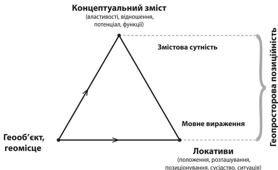
Рис. 3. Семантичний трикутник поняття «Геопросторова позиційність».

Об'єктцентрична і функційна парадигми геопросторової позиційності вирізняються лише гносеологічно, адже геопросторові відношення залежать від властивостей, інтегрального потен-