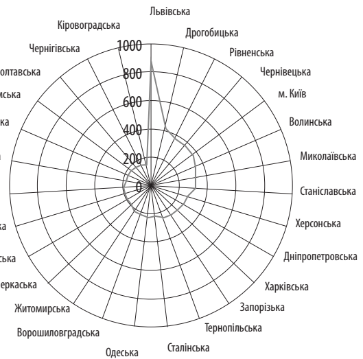
Рис. 2. Зростання валової продукції промисловості у період 1940–1956 рр. по областях УРСР (у % до 1940 р.)

Загальний обсяг промислової продукції в 1956 р. збільшився порівняно з 1940 р. по УРСР в цілому в 2,5 раза, у той час, як по Волинській об-