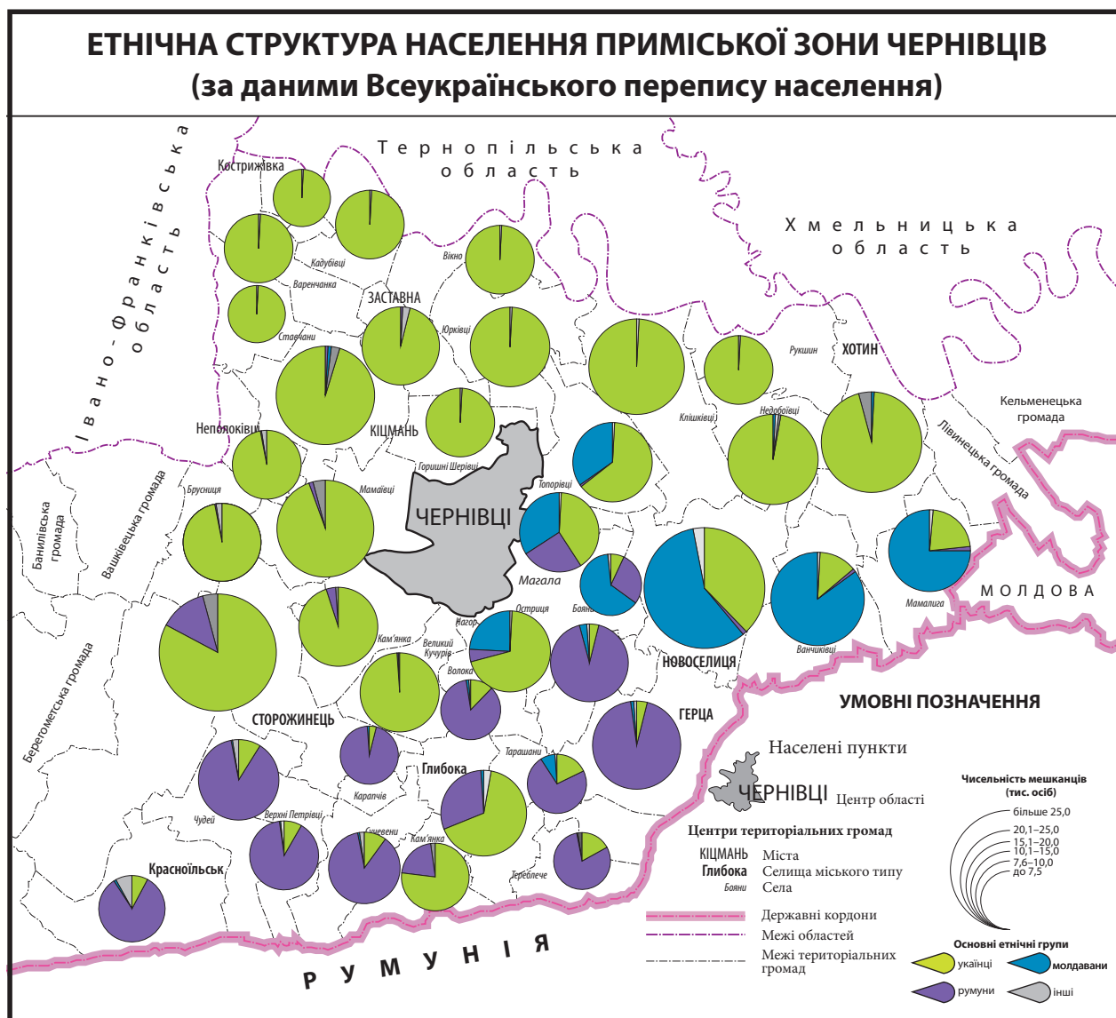
Рис. 1. Етнічна структура населення приміської зони Чернівців.