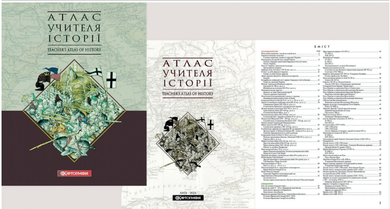
Рис. 1. Загальний вигляд обкладинки і змісту твору «Атлас учителя історії» [9]

хильники такої думки орієнтуються на атласи 1970-1980-х рр.