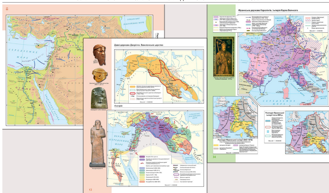
Рис. 2. Окремі сторінки з «Атласу учителя історії» [9]

економічним, історико-етнографічним, історії культури тощо. У кожному історичному періоді виокремлено та пріоритетно представлено карти з історії України. Така структура дозволяє проводити паралелі з сюжетами всесвітньої історії. Кожний розділ супроводжується окремою картою світу або континенту, де надається узагальнений огляд епохи.