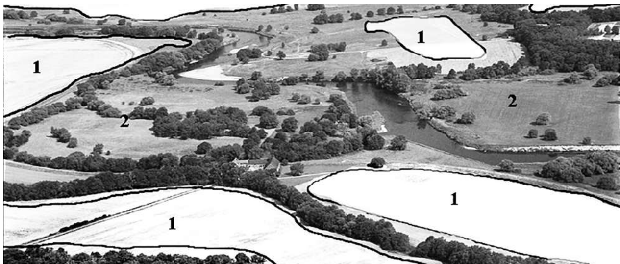
Рис. 1. Принцип виділення просторів для оцінювання образу ландшафту [16]

Основою виділення просторів, однорідних за поєднанням різноманітних природних і створених людиною елементів, які служили опера-