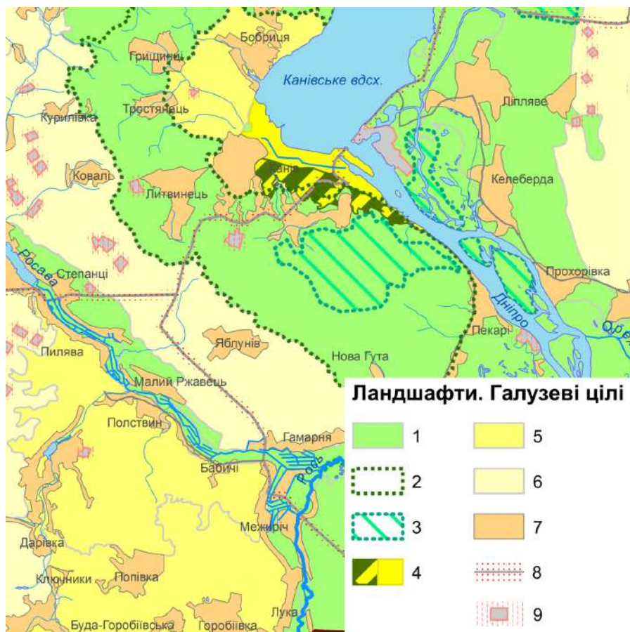
Рис. 3. Цілі збереження, розвитку, поліпшення ландшафтів. Рамковий ландшафтний план Канівського району (фрагмент, зменшене зображення; оригінальний масштаб – 1:50 000)